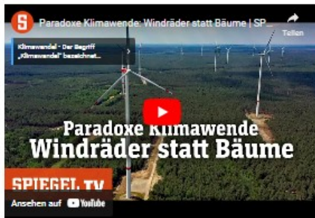
Paradoxe Klimawende: Windräder statt Bäume (SPIE