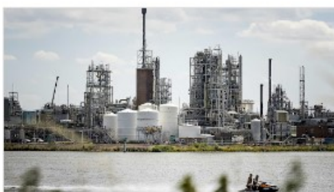
PFAS - Gift für die Ewigkeit (ARD)

(PFAS sind auch in Windradrotoren und gelangen tonnenweisen Abrieb in die Natur und das Grundwasser)