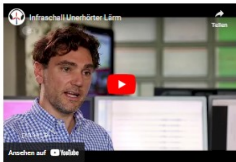
Infraschall unerhörter Lärm (ZDF [planet e])

https://sites.google.com/view/windrad-irrsinn-schwarzwald/startseite