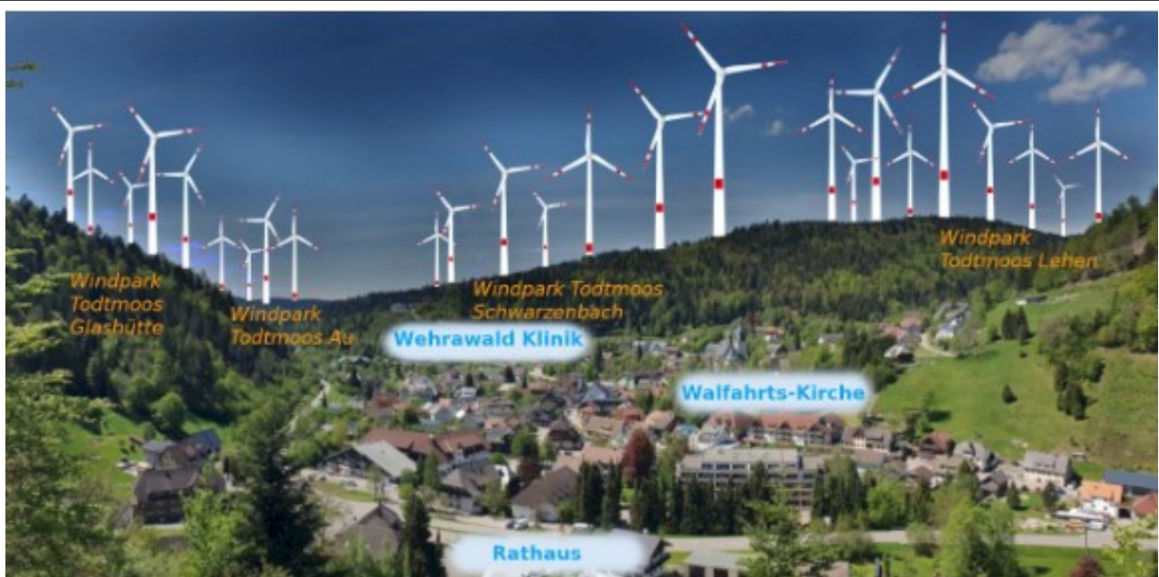
Mögliches Szenario in Todtmoos . Die Windräder auf dem Bild befinden sich auf den offiziell ausgewiesenen Gebieten.