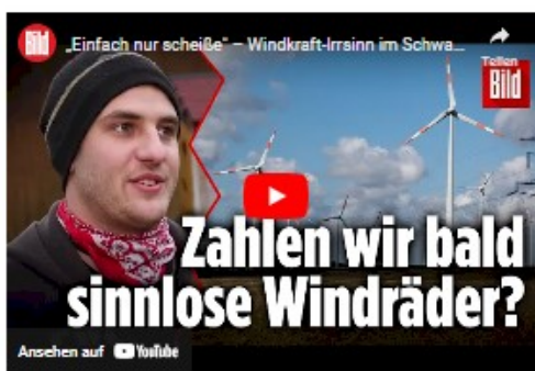
„Einfach nur scheiße“ – Windkraft-Irrsinn im Schwarzwald: Windräder ohne Wind? (Bild TV)

https://www.youtube.com/watch?v=jTA7DcDxpBA