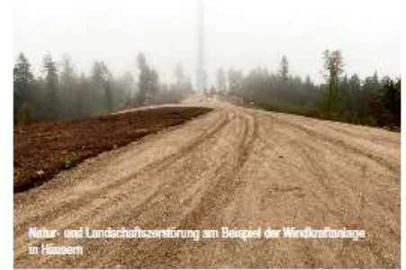
Natur- und Landschaftszerschörung am Beispiel der Windkraftanlage in Häusern

Bitte informieren Sie sich, hinterfragen Sie die Pläne der Landesregierung und sprechen Sie mit Ihrer Familie, Freunden, Nachbarn und den Verantwortlichen vor Ort. Die Landesregierung Baden-Württemberg möchte 1000!!! Windräder in Staatswaldflächen bauen, obwohl vielerorts die netztechnische Infrastruktur (Stromtrassen) es nicht hergibt und keine Speichermöglichkeiten bestehen – der Schwarzwald wäre nicht wieder zu erkennen! Die Natur würde zerstört und dennoch kaum Ertrag! Einen finanziellen Nutzen haben nur die wenigen Projektierer, welche die von öffentlichen Mitteln subventionierten Windkraftanlagen betreiben. Die finanzielle Last und alle mit den Windkraftanlagen verbundenen negativen Auswirkungen tragen die Menschen (Steuerzahler) und die uns umgebende Natur. Das darf nicht sein.