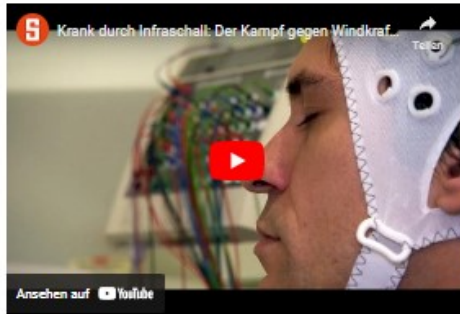
Krank durch Infraschall: Der Kampf gegen Windkraft (SPIEGEL TV)

https://sites.google.com/view/windrad-irrsinn-schwarzwald/startseite