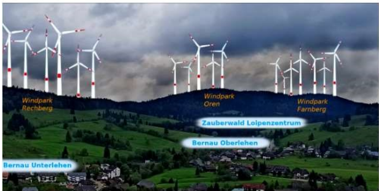
Mögliches Szenario in Bernau . Die Windräder auf dem Bild befinden sich auf den offiziell ausgewiesenen Gebieten.

Leider ist auch dieser schöne Ort in Gefahr !!! Wenige hundert Meter entfernt sind Flächen für riesige Windkraft Anlagen ausgewiesen. (Südkurier Artikel vom 10. März 2024)